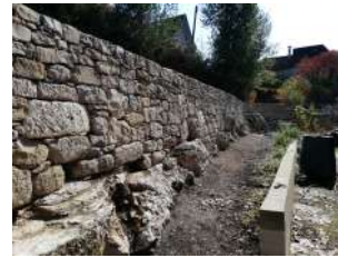
Travaux aux Bertoux