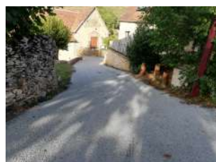
Travaux au Bougayrou