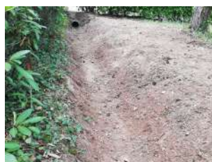
Travaux au cimetière