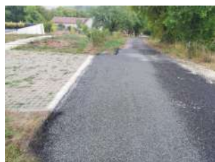
Travaux à Belcastel